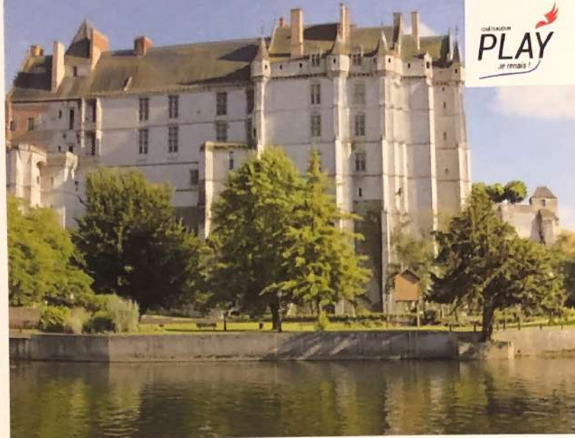
Le château de Châteaudun vu du Loir.

Club canoë kayak dunois - ☎ 06 33 32 53 64 - http://canoë-kayak-chateaudun.fr - 12 €.